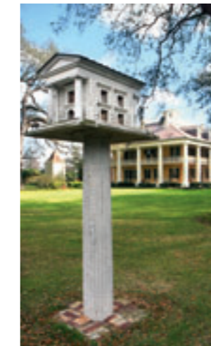
ZELFS DE DUIVENTIL IS ER STIJLVOL.

Laura Plantation (www.lauraplantation.com) is het buitenbeentje: hier geen rondleiding langs antieke meubels maar wel een serie getuigenissen van de masters en van de slaven. De Creoolse eigenaars willen de tijdsgeschiedenis weergeven en onverbloemd de waarheid vertellen. De rondleidingen vragen een voortdurende aandacht van de bezoekers en zijn vaak schokkerend voor naïeve Amerikanen maar laten een onvergetelijke indruk na vooraleer de bezoekers opnieuw de Interstate 10 opdraaien naar het 60 kilometer verder gelegen New Orleans. ➔ Peter Soete