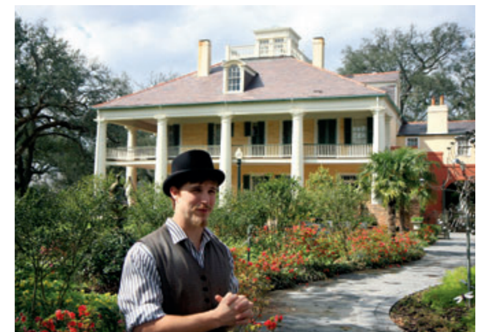
GIDSEN IN AANGEPASTE KLEDERDRACHT LEIDEN JE ROND OP HET DOMEIN.