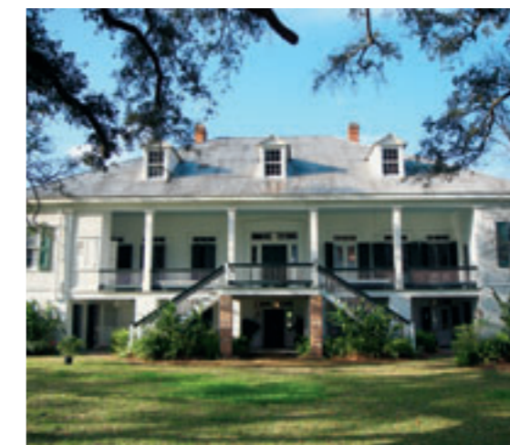
EEN ANDER PALEIS AAN DE MISSISSIPPI: BOCAGE PLANTATION.